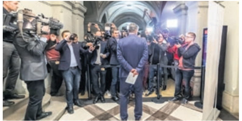
Ständerat Hans Wicki stellt sich den Fragen der Journalisten, nachdem die FDP-Liberale Fraktion ihn und Karin Keller-Sutter für das Ticket nominiert hat. Das Medieninteresse kennt keine Grenzen. (16. November 2018, Bundeshaus)