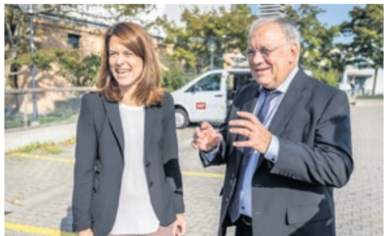
Ein gut gelaunter Bundesrat Johann Schneider-Ammann scherzt mit Petra Gössi. Wenige Minuten später fängt die Delegiertenversammlung an. (29. September 2018, Delegiertenversammlung in Pratteln BL)