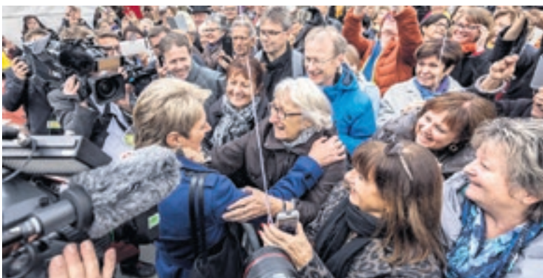
Auf dem Bundesplatz wird unsere neue Bundesrätin von zahlreichen Menschen freudig begrüsst. Sie trifft unter anderem ihre ehemalige Lehrerin. (5. Dezember 2018, Bundesplatz, Bern)