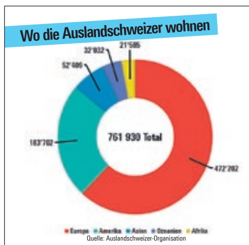
Anteil der im Ausland lebenden Schweizer nach Erdteil. ASO

Als wichtigstes politisches Thema nennen ganze 47 Prozent der Auslandschweizer die Europapolitik (im Inland sind es die Gesundheitskosten). Auch das ist eine grosse Chance für die FDP, denn mit einer konstruktiven und fortschrittlichen Europapolitik, die einsteht für die Zukunft des bilateralen Weges, kann sie sich gerade auch bei den Auslandschweizern profilieren. Nicht zuletzt deshalb, weil die SP in dieser Frage ein Trauerspiel abliefern und sich unter dem Diktat der Gewerkschaften lieber zur SVP in den Schützengraben legt, als die Werte und Interessen der Schweiz zu verteidigen.