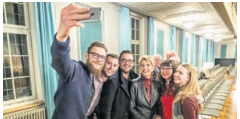
Nicht nur die Medien mögen Karin Keller-Sutter, sondern auch zahlreiche Fans wollen ein Selfie mit ihr. (12. November 2018, Roadshow in Winterthur)