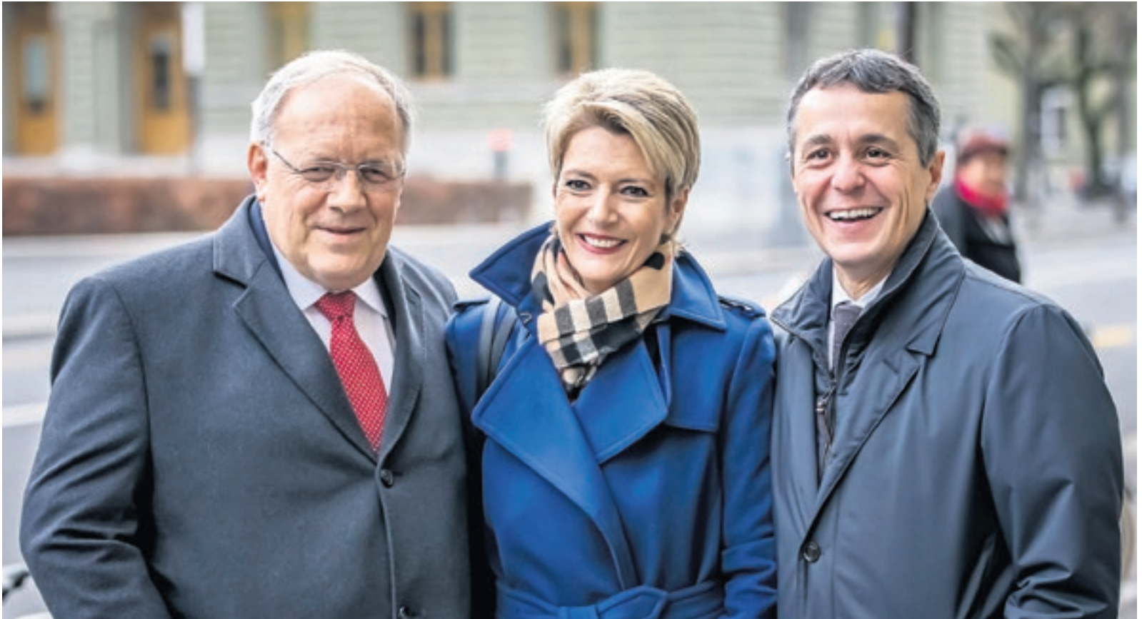
Nach der Medienkonferenz treffen sich alle drei FDP-Bundesräte und gehen gemeinsam zum Public Viewing, um mit der Bevölkerung anzustossen. An drei FDP-Bundesräte könnte man sich durchaus gewöhnen! (5. Dezember 2018, vor dem Medienzentrum des Bundes, Bern)