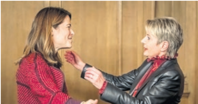
FDP-Präsidentin Petra Gössi gratuliert Karin Keller-Sutter zu ihrer Nomination durch die FDP-Liberale Fraktion. Vor dem Sitzungszimmer warten die Medien auf ein Statement. (16. November 2018, Bundeshaus)