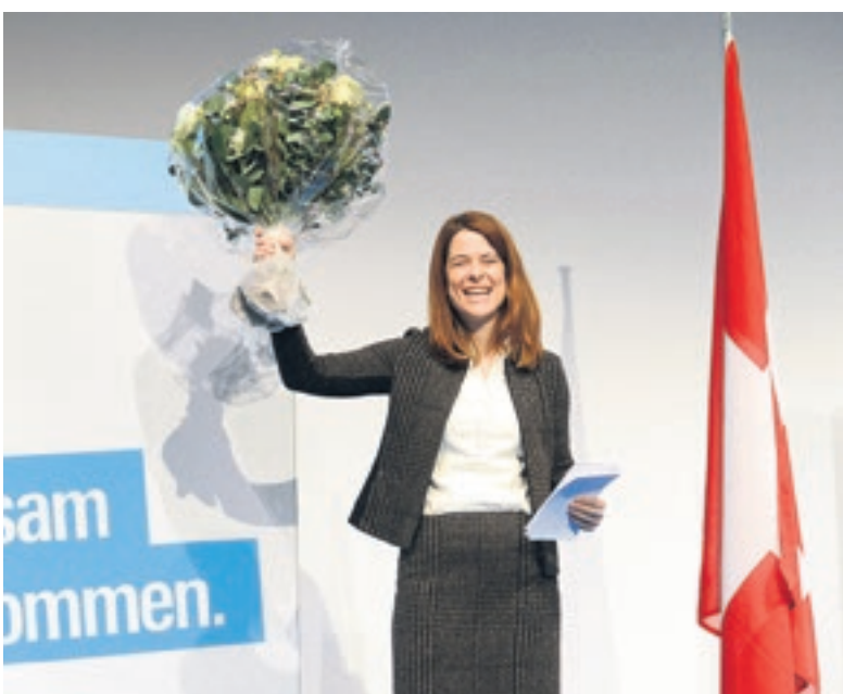
Unsere Präsidentin hat nicht nur die Delegierten auf das Wahljahr eingeschworen, sondern in Biel auch noch ihren Geburtstag gefeiert. Die Blumen nahm sie dankbar entgegen.