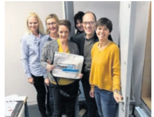
Impressionen von Door2Door-Workshops in Zürich...

Tür-Campaigning in Rahmen von Pilotversuchen bei kantonalen Wahlen in den Kantonen Zürich, Luzern und Basel-Landschaft sowie St. Gallen und Tessin getestet. Fallen die Erfahrungen vielversprechend aus, soll die Methode im Hinblick auf die nationalen Wahlen landesweit zum Einsatz kommen.