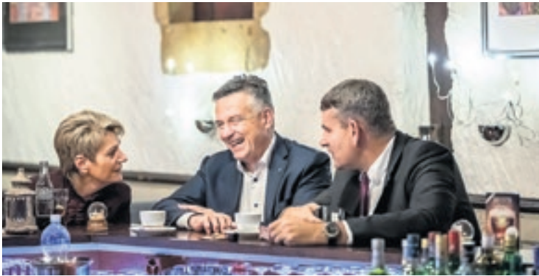
Die drei Kandidaten sind zwar Konkurrenten und schenken sich nichts. Aber sie verstehen sich sehr gut und die Atmosphäre ist immer angenehm. (14. November 2018, vor der Roadshow in Yverdon)