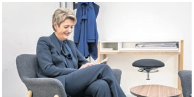
Karin Keller-Sutter nutzt eine der seltenen Verschnaufpausen und schaut sich ihre vielen Gratulationsbotschaften an. Wenige Minuten später geht es weiter in den «Rundschau Talk» im Fernsehen SRF. (5. Dezember 2018, Medienzentrum des Bundes, Bern)