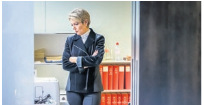
Volle Konzentration: Karin Keller-Sutter in den Minuten vor dem Hearing bei der SP. Sie weiss, von diesen Gesprächen hängt vieles ab. (4. Dezember 2018, Fraktionsbüro FDP, Die Liberalen, Bundeshaus)