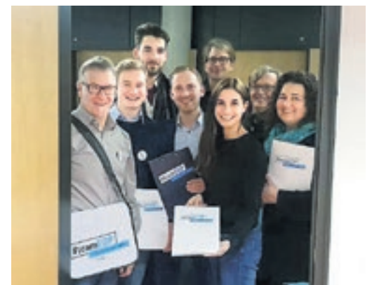
und Luzern – das Team FDP ist schon hochmotiviert!