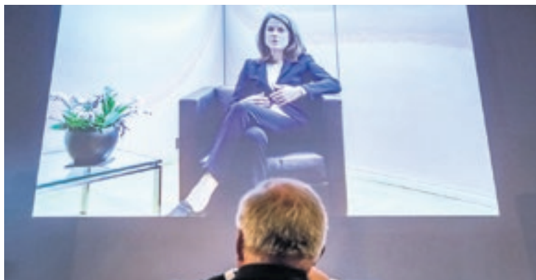
Bundesrat Johann Schneider-Ammann lauscht gespannt den zahlreichen Dankesbotschaften, welche die Mitglieder der FDP-Liberalen Fraktion auf Video aufgenommen haben. (29. September 2018, Delegiertenversammlung in Pratteln BL)