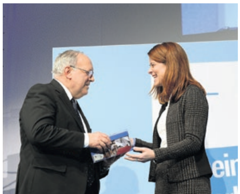
Petra Gössi übergibt Johann Schneider-Ammann eine Gutschein-Box für Ausflüge mit seinen Enkelkindern.