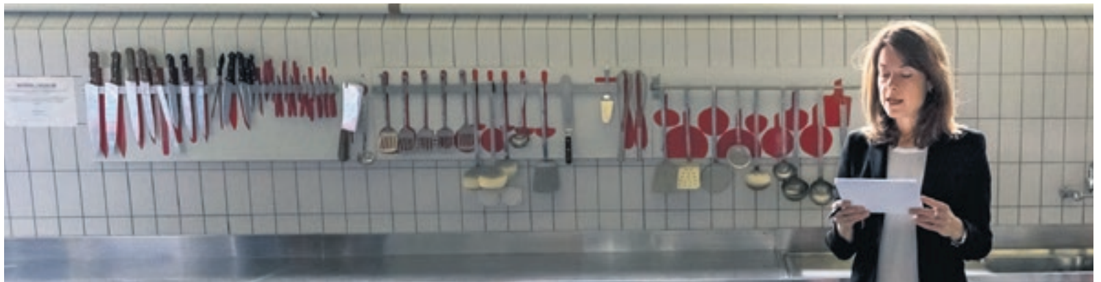
FDP-Präsidentin Petra Gössi übt ihre Rede in der Küche des Kongresszentrums. Bundesrat Schneider-Ammann hat wenige Tage zuvor seinen Rücktritt bekannt gegeben. Sie wird ihm für seinen enormen Leistungsausweis danken, und die Delegierten werden es mit mehreren stehenden Ovationen belohnen. (29. September 2018, Delegiertenversammlung in Pratteln BL)