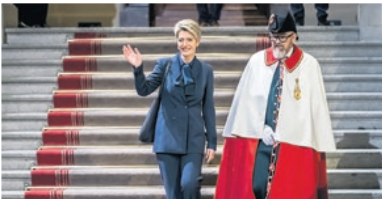
Die strahlende Bundesrätin: Kurz nach der Wahl kommt Karin Keller-Sutter über die Treppe hinab in die Kuppelhalle. Draussen auf dem Bundesplatz wird sie bereits von vielen begeisterten Menschen erwartet. (5. Dezember 2018, Bundeshaus, Bern)