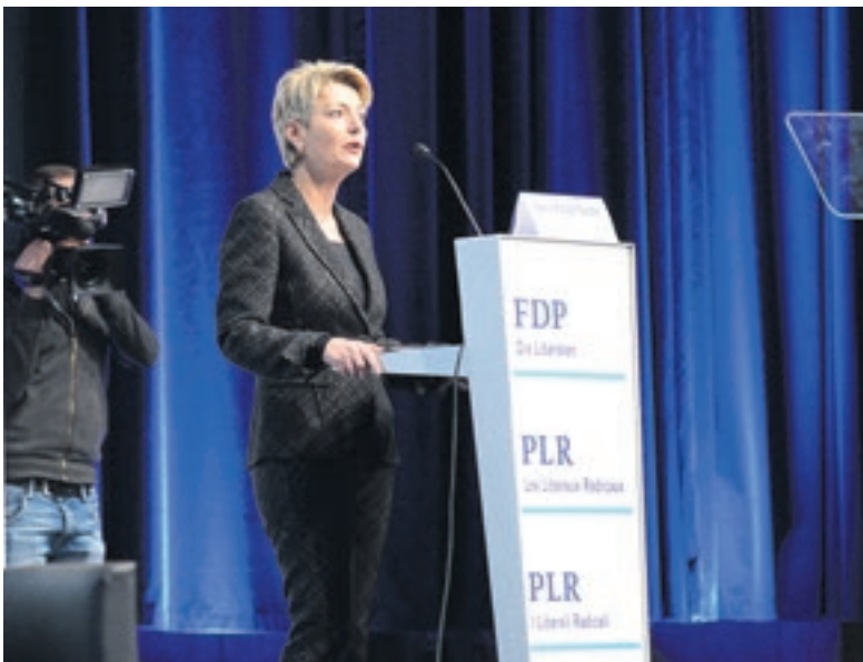
«Die Menschen erwarten von der Politik nicht, dass sie ihnen alle Sorgen abnimmt. Aber sie erwarten von uns, dass wir sie in ihrer persönlichen Freiheit nicht noch mehr einschränken», ist unsere neue Bundesrätin Karin Keller-Sutter überzeugt.

Nach einer spannenden Debatte haben die Delegierten dann auch die Änderung der EU-Waffenrichtlinie mit 250 zu 46 bei 5 Enthaltungen angenommen. Sie wollen das für die Sicherheit in der Schweiz so wichtige Schengen-Abkommen nicht gefährden und betrachten die Änderungen für die Schützinnen und Schützen als zumutbar.