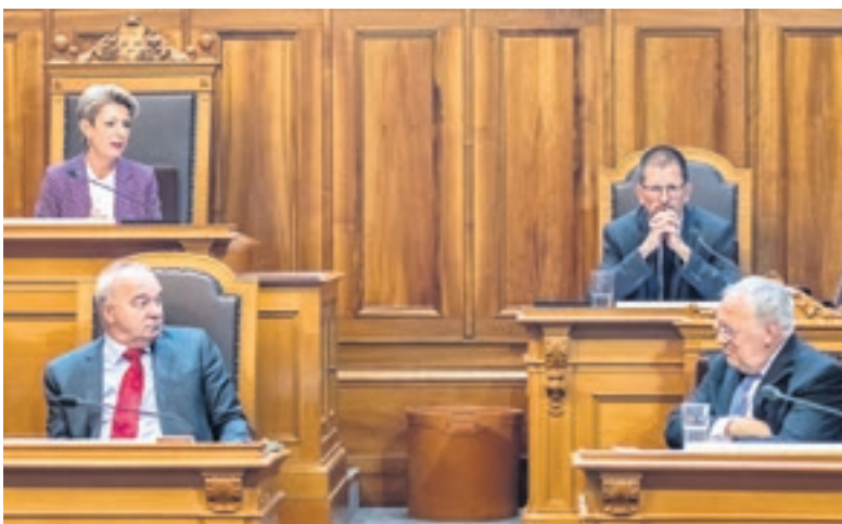
Am Morgen, an dem im Nationalrat sein Rücktrittsschreiben verlesen wird, sitzt Bundesrat Schneider-Ammann im Ständerat. Dieser wird von Karin Keller-Sutter präsidiert – und sie nimmt die Gelegenheit sogleich wahr, um ihn zu würdigen. (25. September 2018, Ständeratssaal, Bundeshaus)