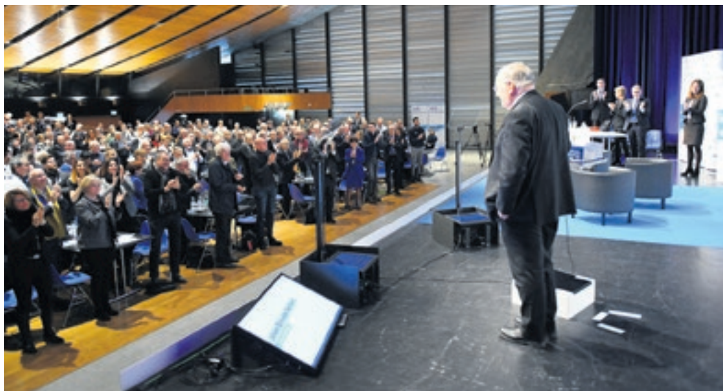
Ein emotionaler Moment: Die Delegierten danken und verabschieden den verdienten Bundesrat mit stehenden Ovationen.

Wo ein Ende ist, ist auch ein Anfang. So haben die Delegierten ihre neue Bundesrätin, Karin Keller-