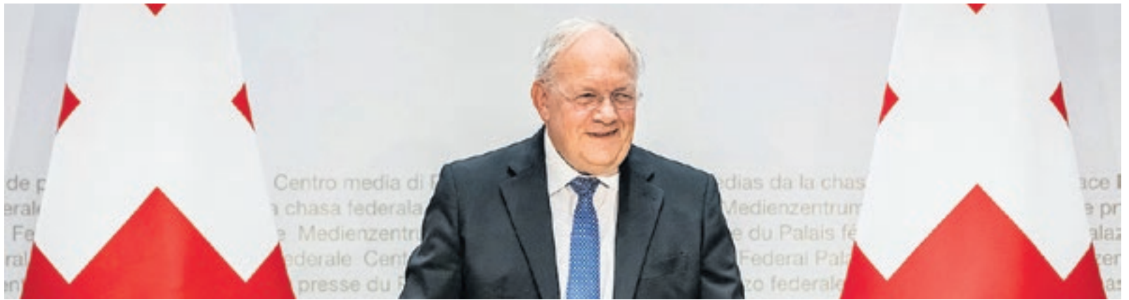
Johann Schneider-Ammann beantwortet die Fragen der Journalisten zu seinem Rücktritt. Er überzeugt mit Schlagfertigkeit und Witz. Sein Spruch «Es geht mir gut – ich bin wach» ist mittlerweile legendär. (25. September 2018, Medienzentrum des Bundes, Bern)