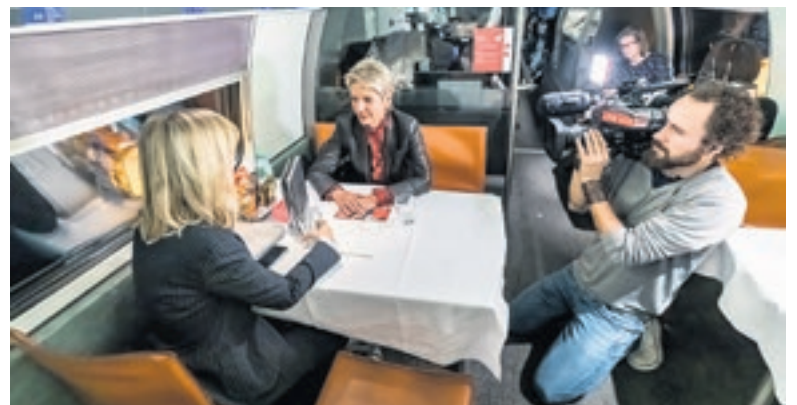
Die Kandidatin Karin Keller-Sutter nimmt den Zug nach Winterthur an eine der drei Roadshows der FDP. Dabei wird sie von einem Team vom Schweizer Radio und Fernsehen (SRF) begleitet. (12. November 2018, Intercity zwischen Bern und Winterthur)