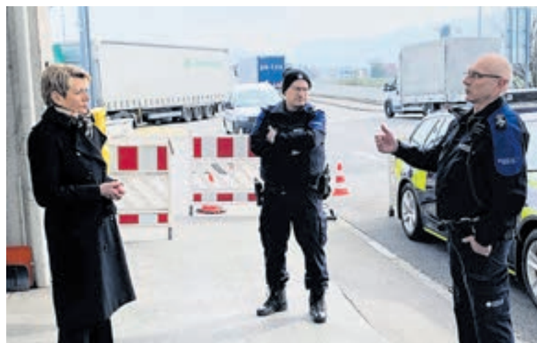
Karin Keller-Sutter am Grenzübergang Au SG.