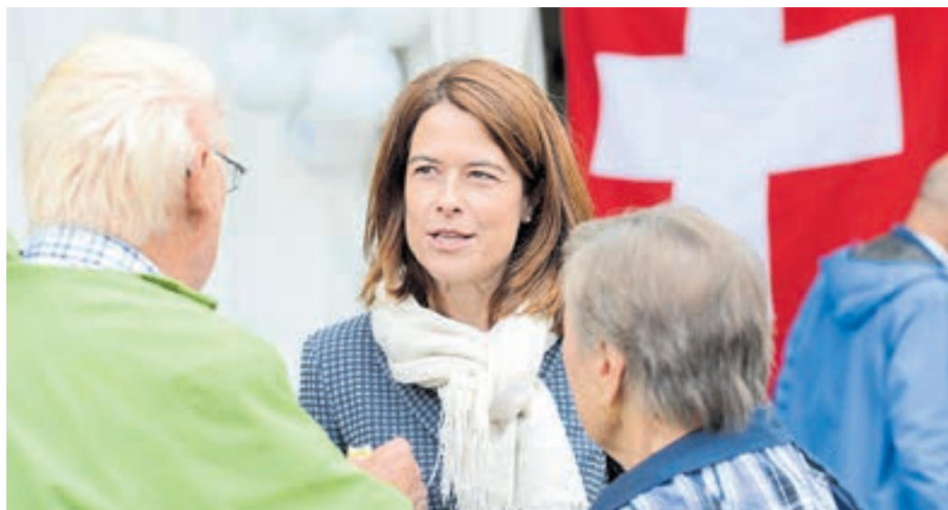
Hoffentlich bald wieder Realität ohne Social Distancing: Petra Gössi im Gespräch an einem Tag der FDP.

Petra Gössi, Küssnacht Nationalrätin und Parteipräsidentin FDP.Die Liberalen