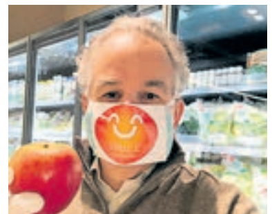
Auch die FDP Lugano ist für Risikogruppen unterwegs.