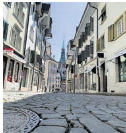
Leere Gassen in Solothurn.

Die Aufrechterhaltung einer funktionierenden Gesundheitsversorgung in einer so anspruchsvollen Zeit verlangt einen sehr hohen persönlichen und wirtschaftlichen Preis von allen. Liebgewonnene Gewohnheiten und Freiheiten mussten von einem Tag auf den andern aufgegeben werden, soziale Kontakte und Freundschaft sind nur noch sehr eingeschränkt möglich, der Kulturbetrieb ist zum Erliegen gekommen, Lernen und Arbeiten finden nur noch digital statt, Kurzarbeit und Arbeitslosigkeit stehen an, und ganze Branchen stehen vor dem Aus. Nur die wenigsten von uns hätten sich vor ein