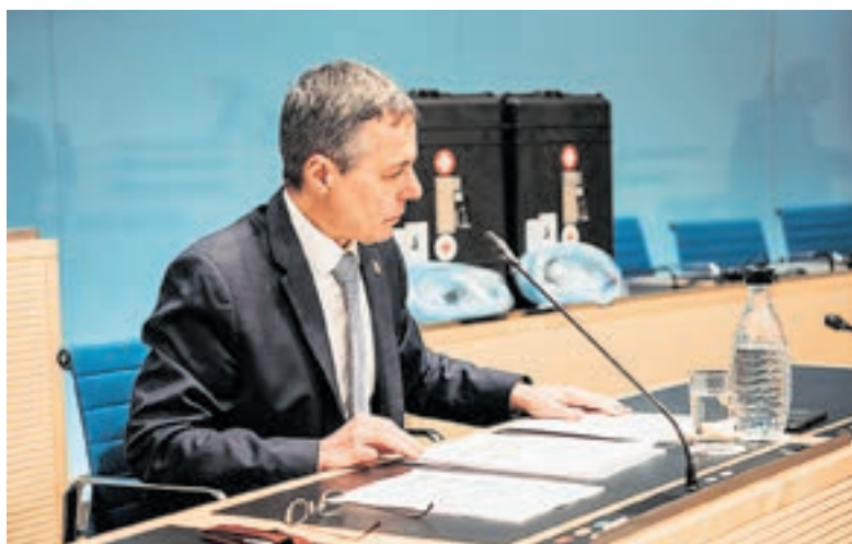
BR Ignazio Cassis an einer Medienkonferenz im Tessin.

KKS: Es berührt mich sehr, wie verantwortungsvoll unser Land diese Krise angeht. Ich war im Rheintal am Grenzübergang Au und habe die Firma SFS besucht. In dieser Exportregion arbeiten viele Grenzgänger. Hier sieht man ganz konkret, wie wichtig das Zusammenspiel zwischen Gesundheit, Grenzkontrollen und Arbeitsplätzen ist. Besonders nahe geht mir auch die Schliessung der vielen Geschäfte. Ich bin selbst in einem Restaurant aufgewachsen und weiss, was das für die eigene Existenz bedeutet. Die Konsequenzen für die Wirtschaft sind schon heute gravierend. Ich bin aber überzeugt, dass unser Land die Stärke hat, um die Krise zu meistern.