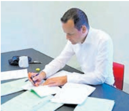
Damian Müller bei der Kommissionarbeit im Homeoffice.