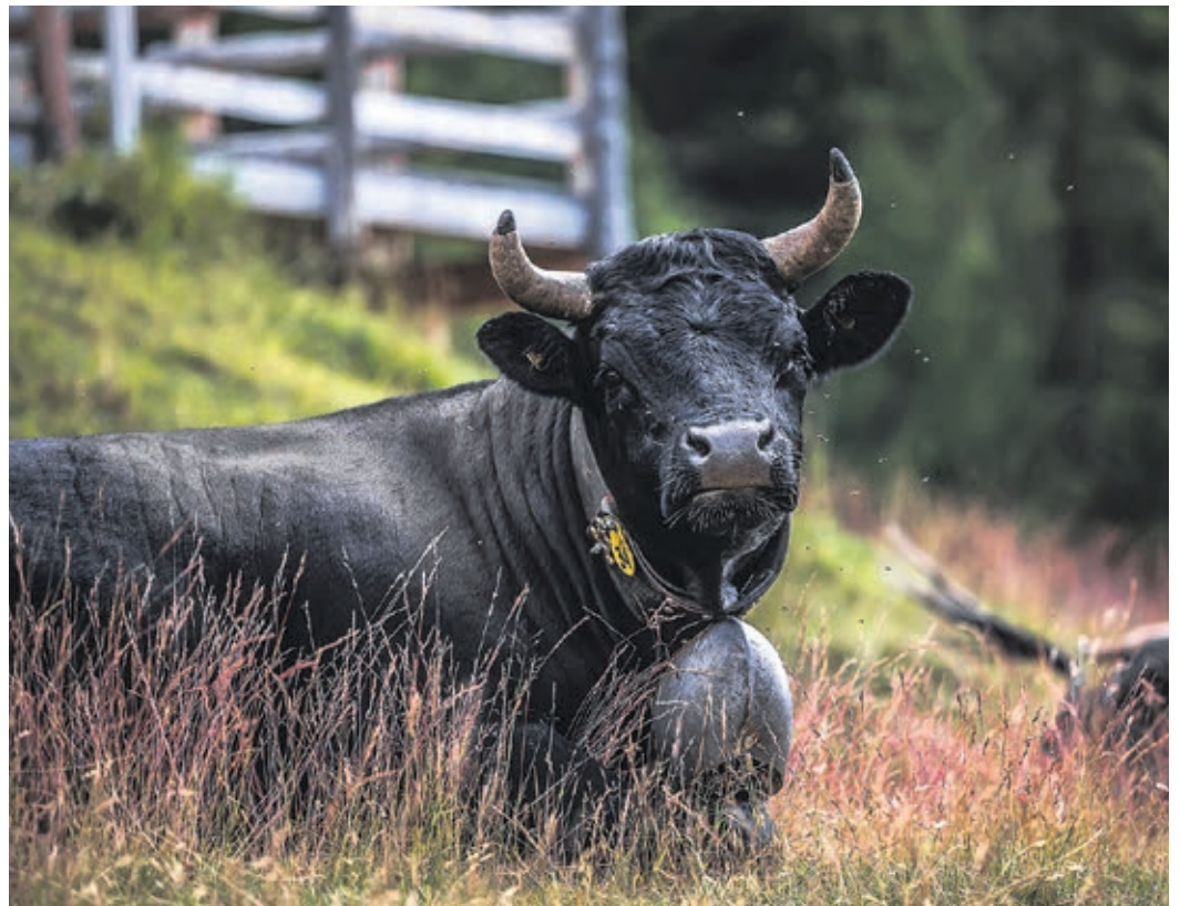
Die beiden Agrarinitiativen schiessen übers Ziel hinaus.