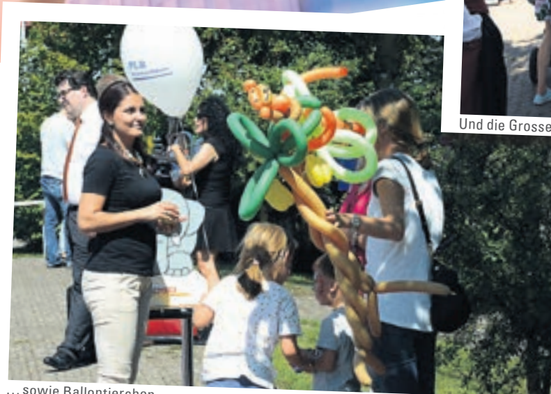
... sowie Ballontierchen.

Partylaune und Ballone haben den Tag geprägt! Ganz entspannt und ohne Krawatte haben die Freisinnigen das Sommerwetter genossen. Am grossen Volksfest der FDP war für jeden etwas dabei. Die Schleckmäuler bekamen Mohrenköpfe, Gesprächige durften mit unseren Kandidaten politisieren.