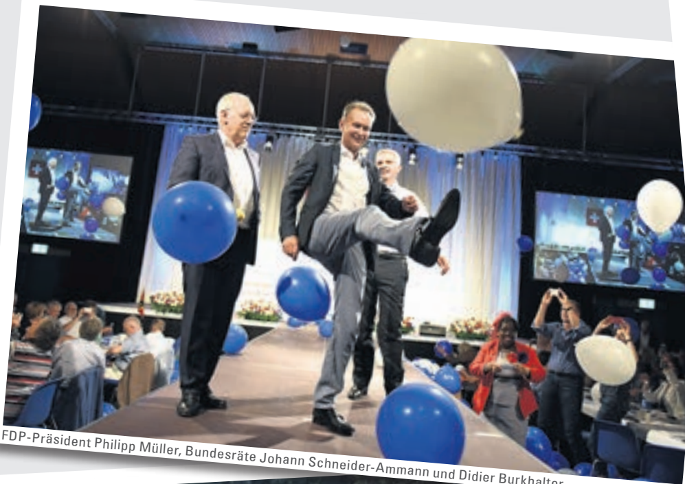
FDP-Präsident Philipp Müller, Bundesräte Johann Schneider-Ammann und Didier Burkhalter

Am 22. August hat die FDP mit einem Volksfest die Schlussphase des Wahlkampfes um die eidgenössischen Wahlen eingeläutet. Über 1500 Freisinnige, Parteimitglieder und Sympathisanten, wurden in Sursee von der Sonne empfangen. Wir haben unsere drei Werte Freiheit, Gemeinsinn und Fortschritt mit vielen Ballonen, gutem Essen, einer Hüpfburg und mit Alphornmusik und Jodel gefeiert. Auf diesen zwei Seiten finden Sie eine Auswahl der schönsten Impressionen des Tages. Alle Bilder finden Sie auf unserer Website: www.fdp.ch .