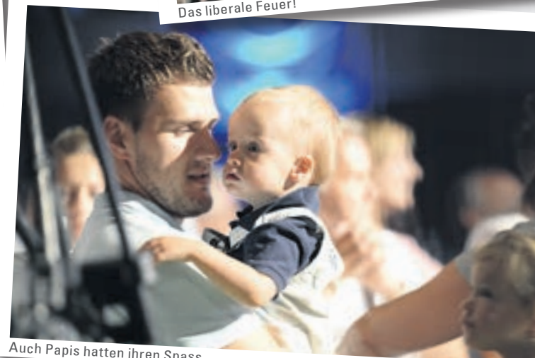
Auch Papis hatten ihren Spass.