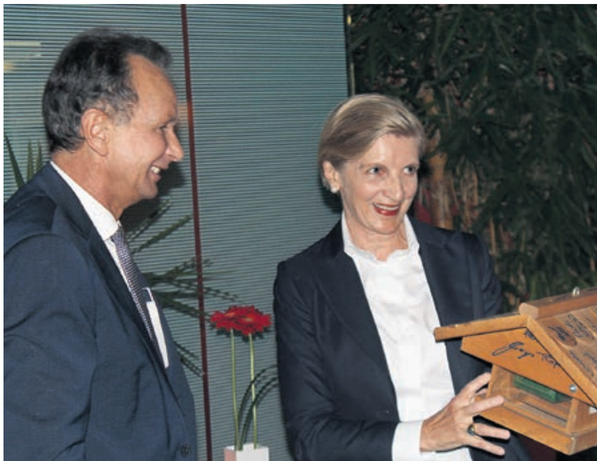
Parteipräsident Philipp Müller und Fraktionspräsidentin Gabi Huber.