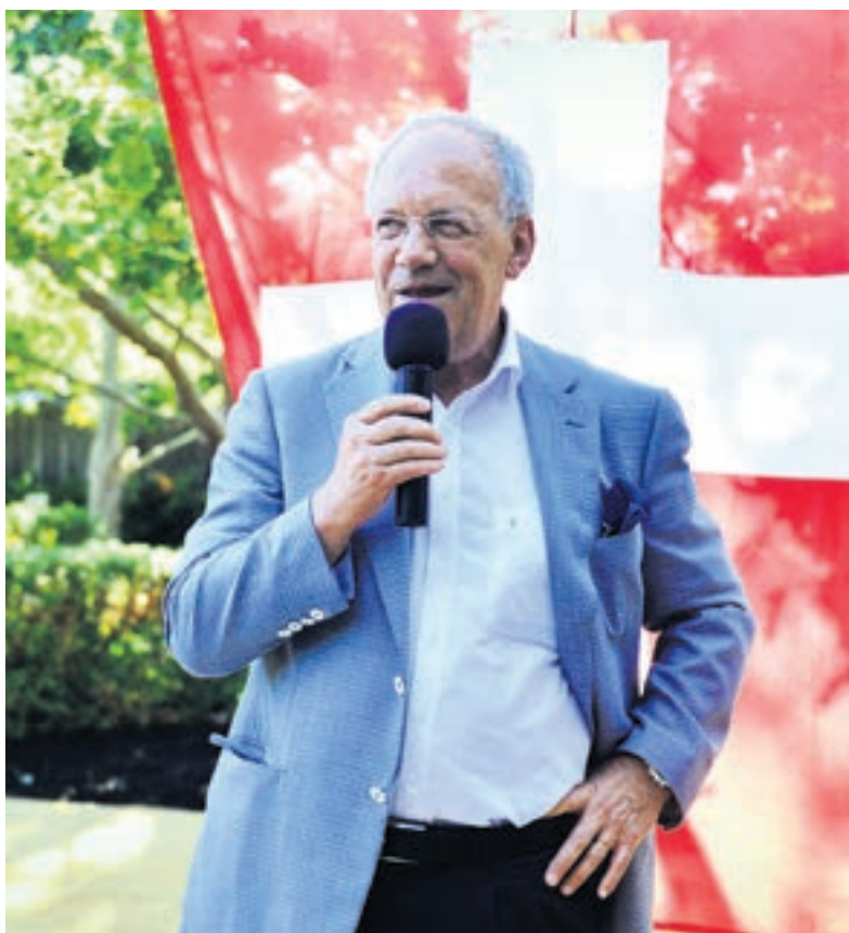
Johann N. Schneider-Ammann

Der Bundesrat hat deshalb Anfang September Bilanz gezogen und in einem neuen Bericht weitere Massnahmen zur administrativen Entlastung beschlossen. Darunter sind prioritär die Ermöglichung der elektronischen, medienbruchfreien Zahlung