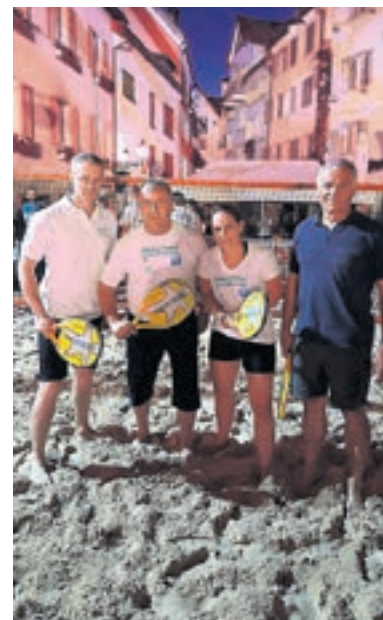
Vier der zehn Bündner Kandidaten für den Nationalrat stellten sich dem Wettbewerb beim Beach-Tennis-Turnier in Chur.

Und natürlich kommunizieren wir laufend den Slogan «für Arbeitsplätze in Graubünden» und verkünden so, dass wir (echte) Bündner Kandidaten (als Anspielung auf Kandidaten anderer Parteien mit Wohnsitz in Zürich!) auf Bündner Plakaten haben. Wir produzieren alle Werbemittel in Graubün-