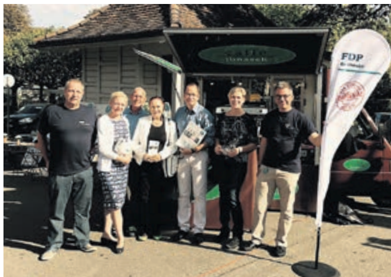
Die Basler Kandidaten diskutieren jeweils am Samstagmorgen bei Kaffee und Gipfeli mit den Wählern.