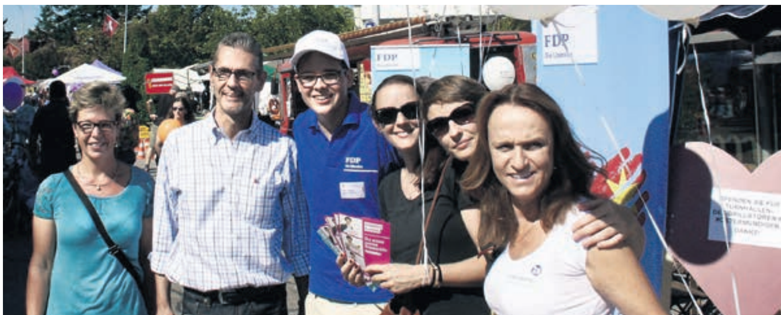
Berner Kandidatinnen und Kandidaten im Einsatz in Ostermündigen.