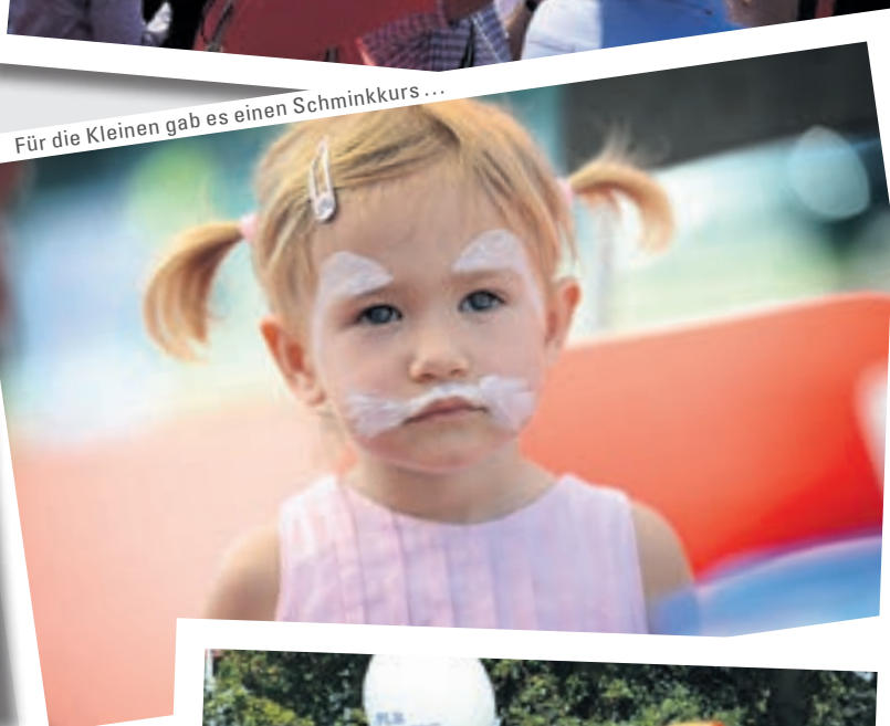
Für die Kleinen gab es einen Schminkkurs...