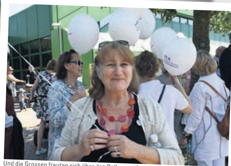
Und die Grossen freuten sich über den Ballonwettbewerb.