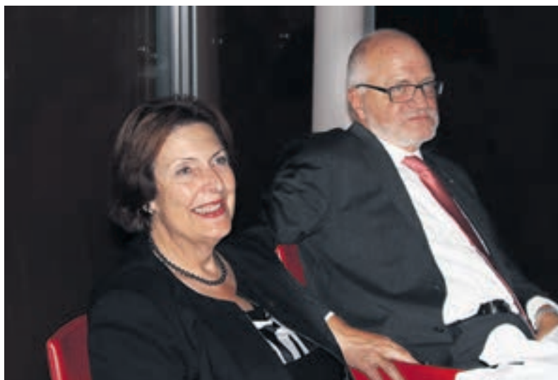
Ständerätin Christine Egerszegi und Ständerat Georges Theiler.