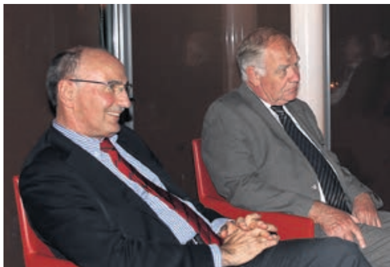
Ständerat Felix Gutzwiller und Ständerat Hans Hess.