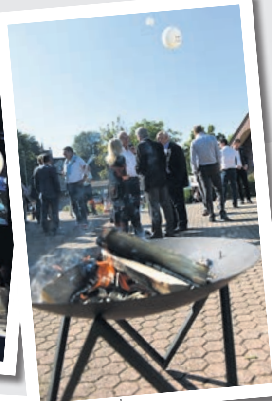
Das liberale Feuer!