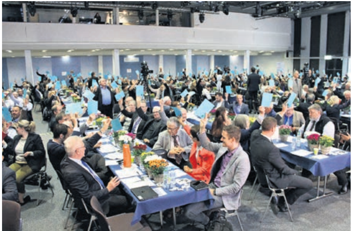
Die Delegierten fassten richtungsweisende Abstimmungsparolen.

Parteipräsidentin Petra Gössi wies nicht ohne Stolz auf den im Nationalrat erreichten Kompromiss zur Umsetzung der Masseneinwanderungsinitiative hin. Dass die FDP nun im Gegenwind stehe, sei nicht verwunderlich, denn: Wir machen Politik nicht um zu gefallen, sondern um zu bewirken. Dieser Vorschlag erlaube es, die Zuwanderung zu senken und gleichzeitig die bilateralen Verträge zu sichern, unterstrich die Parteipräsidentin. Bundespräsident Johann Schneider-Ammann betonte ebenfalls