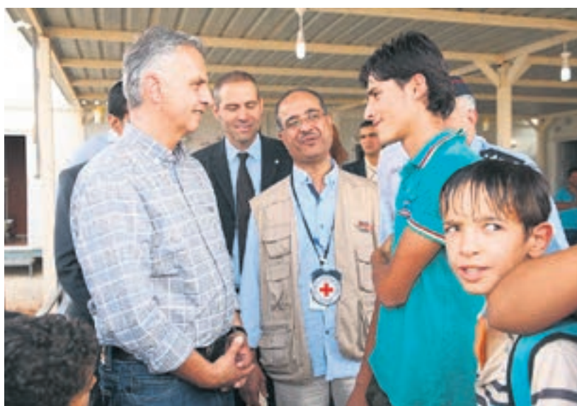
Im Dialog: Wer die Situation anderer Menschen versteht, kann wirksam reagieren.

Entsprechend ist «im Dienste der Menschen» auch bei der Internationalen Zusammenarbeit zentral. Dank der Unterstützung der Schweizerinnen und Schweizer kann unser Land konkrete Hilfe leisten, um die Situation der Menschen in Not zu erleichtern. So hat die Schweiz den humanitären Organisationen in Syrien Ambulanzfahrzeuge zur Verfügung gestellt. Und sie hat in Libanon und Jordanien Schulen renoviert, in denen gegen 100 000 Kinder zur Schule gehen. Hier wird besonders deutlich, was es heisst, Perspektiven zu schaffen: Nimmt man eine Schulklasse im Konfliktgebiet als Beispiel, haben von 20 Kindern zwei wegen des Krieges ihr Leben verloren, acht mussten fliehen und 16 sind auf humanitäre Hilfe angewiesen, um Essen zu erhalten. Sich zu engagieren bedeutet, den Menschen vor Ort Perspektiven zu verschaffen – und darüber hinaus auch den Druck zur Migration oder das Risiko einer Abwerbung durch extremistische Gruppen zu vermindern.