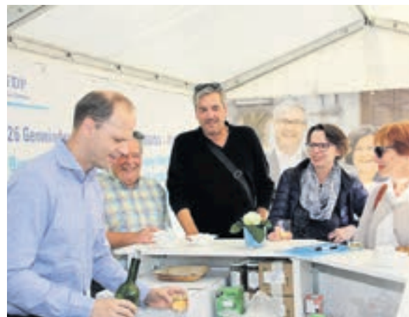
Apérozeit an der MIO in Olten.

sen sich von den blauen und weissen FDP-Ballons anziehen, während die Mittelalterlichen ihr Glück beim Swisslos versuchten.