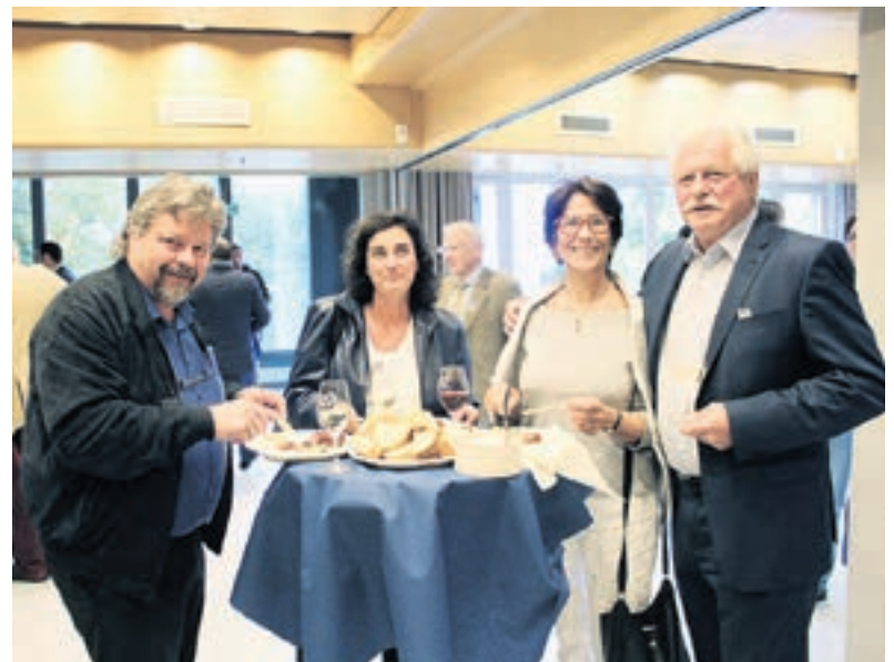
Nach einem ereignisreichen Tag genossen die Delegierten einen reichhaltigen Apéro.