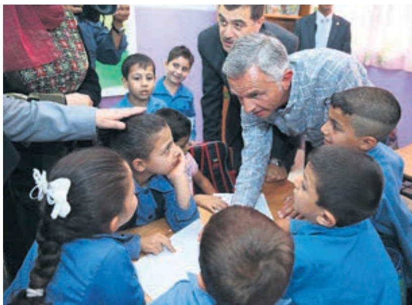
Perspektiven schaffen: Bundesrat Didier Burkhalter spricht mit Schulkindern in Jordanien.

Ein solches Engagement muss langfristig angelegt sein, damit es nachhaltig wirkt. Doch dann kann es auch in Notsituationen helfen. So konnten sich in Haiti nach dem Sturm «Matthew» viele Menschen in Sicher-