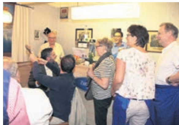
... und am Abend.