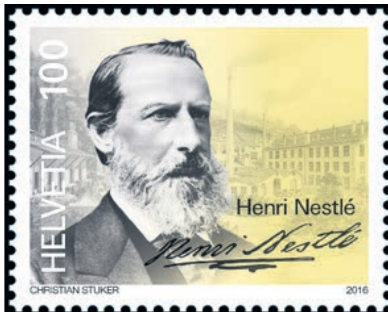
Henri Nestlé: Kind der Personenfreizügigkeit und Pionier des Erfolgsmodells Schweiz.

Nestlé, Maggi, BBC: Es war nichts anderes als der Anfang des Erfolgsmodells Schweiz. Untrennbar verbunden mit einer frühen Form der europäischen Personenfreizügigkeit, ausgehend von den liberalen Gründervätern der Schweiz. Sie zu verteidigen war schon immer die Aufgabe der Liberalen und Progressiven. Und es lohnt sich: Unsere Schweiz ist selbst das beste Beispiel dafür.