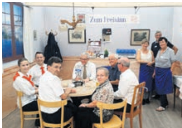
Die Freisinn-Beiz am Nachmittag ...

Die Herbstmesse Solothurn zog auch heuer wieder Tausende Besucherinnen und Besucher in die Ambassadorsstadt. Ob ganz alle auch wirklich am FDP-Stand «Zum Freisinn» einkehrten, ist nicht überliefert. Ganz sicher war aber auf den Messegängen allenthalben zu hören: «Chumm, mir göh no ufenes Bier i Freisinn!» Dort wirkten in der heimelig eingerichteten FDP-Gaststube während zehn Tagen im Schichtbetrieb eine Vielzahl der 26 freisinnigen Kantonsrätinnen und Kantonsräte, Parteivorstandsmitglieder, Gemeinderäte aus der Stadt Solothurn sowie weitere Freunde der FDP.