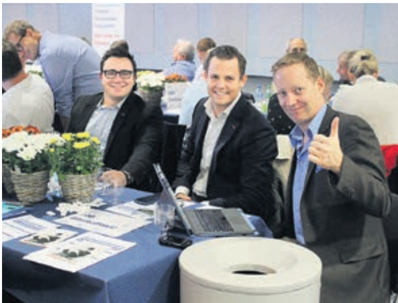
Auch die FDP International war an der Delegiertenversammlung gut vertreten.