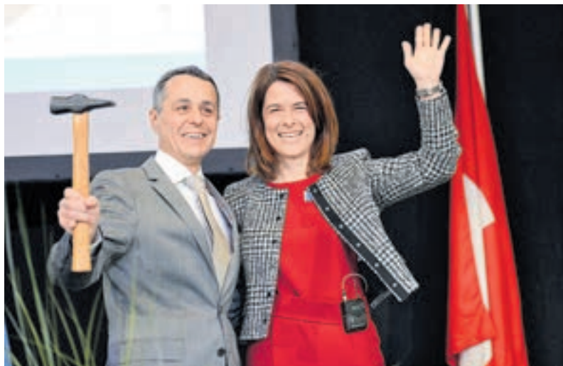
Parteipräsidentin Petra Gössi überreichte Ignazio Cassis einen Schmiedehammer.

Kompetenz ausgezeichnet, seinen Respekt gegenüber den Institutionen unseres Landes und seinen Einsatz für das Gemeinwohl. In seiner Zeit als Bundesrat war er ein exzellenter Vertreter schweizerischer und liberaler Werte – weniger reden, mehr anpacken. Die FDP würdigte ihren Aussenminister: «Wir wünschen Deiner Familie und Dir nur das Beste und hoffen, dass wir Dich weiterhin als unseren liberalen Leuchtturm betrachten dürfen. Wir sind stolz und dankbar für Deine ausgezeichnete Arbeit!» Petra Gössi überreichte Didier Burkhalter ein Bild des Monte-Rosa-Massivs mit dem zweithöchsten Schweizer Berg, der Dunantspitze, für dessen Umbenennung Didier Burkhalter 2014 die Idee hatte. Zudem wurde eine Spende in seinem Namen bei der Stiftung Theodora in Auftrag gegeben.