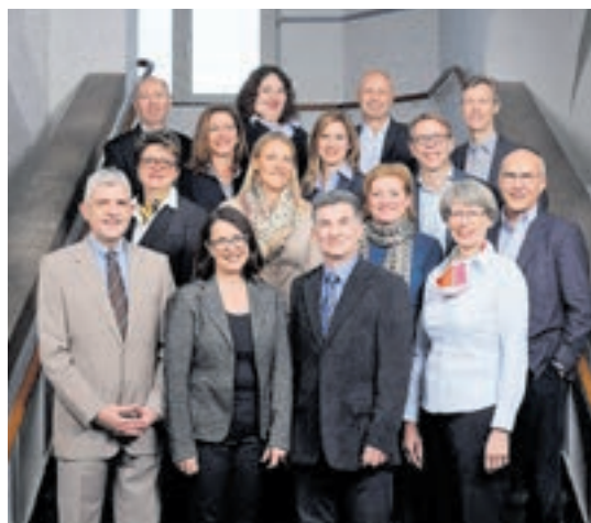
Die FDP Meilen freut sich auf das grosse Jubiläum.

sind. Sie sind Ergebnis vieler grosser und kleiner politischer Initiativen, des Engagements vieler im Milizsystem, begleitet sowohl von Rückschlägen als auch von Erfolgen, seit der Gründung unseres Bundesstaates 1848. 1918 gewannen andere Parteien die Nationalratswahlen im Umfeld eines kriegsgeschundenen Europa. Der Arbeiterkongress besprach die desolante wirtschaftliche Lage der Arbeiterschaft. Die Zahl der Notstandsberechtigten erreichte ein Rekordniveau von 692'000. Der Bundesrat erliess eine Verordnung gegen Preiswucher, und der Generalstreik schuf ein explosives soziales Spannungsfeld. Vor diesem Hinter-