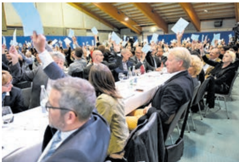
Einstimmig verabschieden die Delegierten die Tourismus-Resolution.

Raumplanung unterlassen werden und eine wirtschaftsfreundliche, nachhaltige Klimapolitik angestrebt wird. Diese Punkte sind in der FDP-Tourismus-Resolution aufgearbeitet, welche die Delegierten einstimmig verabschiedeten.