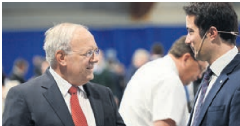
Bundesrat Johann Schneider-Ammann wird am Parteiabend in Aetigkofen sprechen.

Mediamatik-Lernende der Swisscom waren in den letzten Tagen mit einer Videokamera auf den Strassen des Kantons Solothurn unterwegs. «Was erwarten Sie vom Solothurner Freisinn?», wurden die Bürgerinnen und Bürger gefragt. Das verblüffende Resultat sehen Sie in einem Zusammenschnitt. Wertvolle Anstösse für die