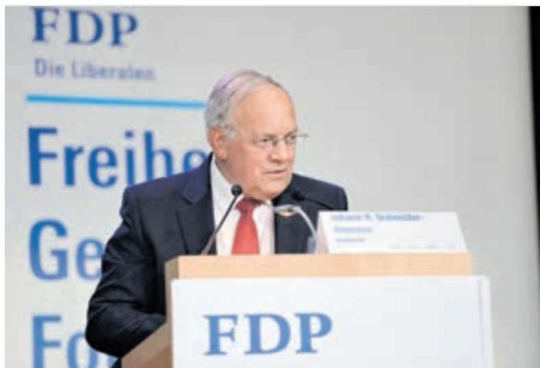
Bundesrat Johann Schneider-Ammann möchte den Tourismusstandort Schweiz stärken.

Raumplanung unterlassen werden und eine wirtschaftsfreundliche, nachhaltige Klimapolitik angestrebt wird. Diese Punkte sind in der FDP-Tourismus-Resolution aufgearbeitet, welche die Delegierten einstimmig verabschiedeten.