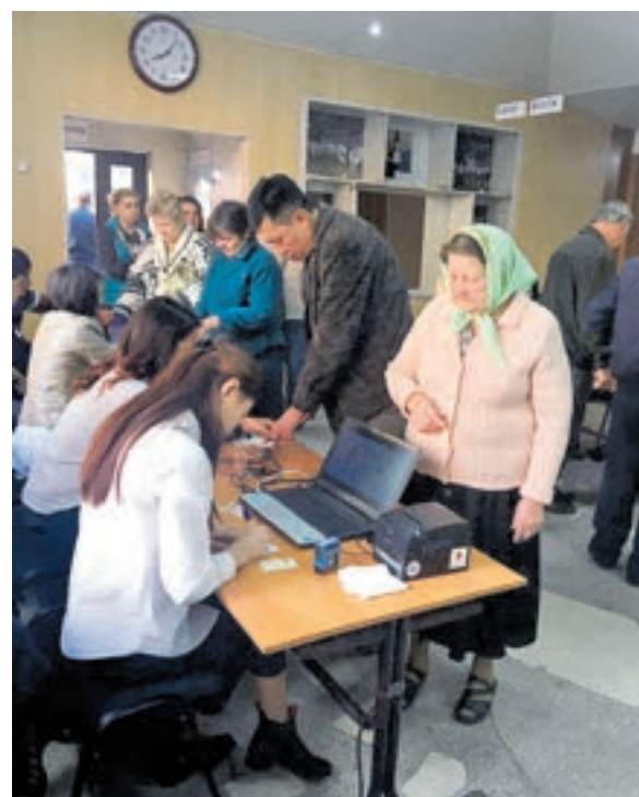
Biometrische Kontrolle und Fingerprint.