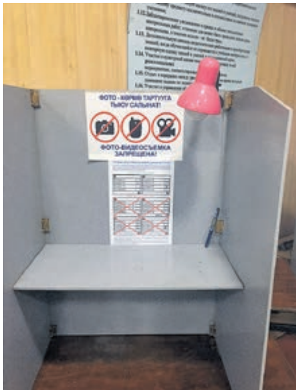
Wahlzettel sind vertraulich auszufüllen.