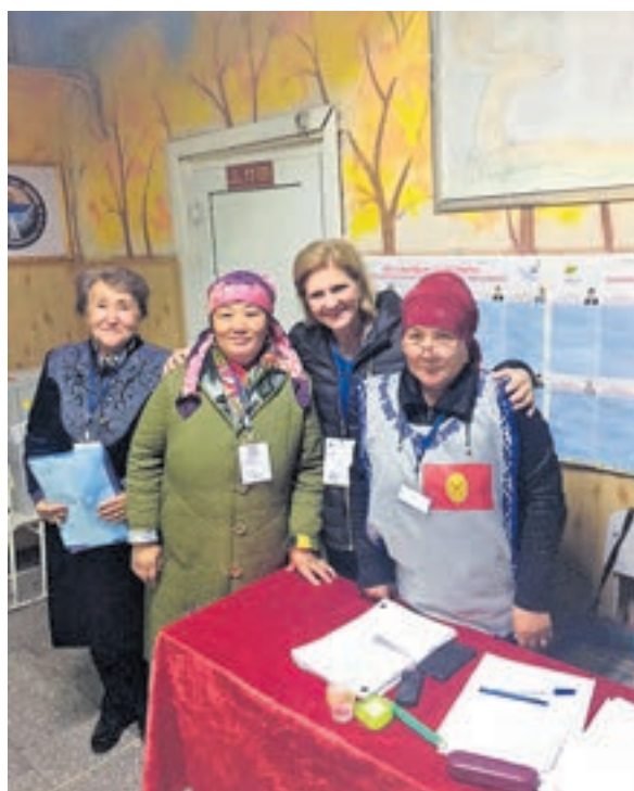
Am Wahltag zusammen mit Wahlhelferinnen.

Der demokratische Fortschritt anlässlich der Präsidentschaftswahlen vom 15. Oktober war unverkennbar: Ein «harmonischer» Übergang vom freiwillig scheidenden Präsidenten zu einer neuen Führung war geprägt von technisch gut organisierten Wahlen, aber auch von krass ungleich verteilten Finanzmitteln zur Bewerbung der Wahl. Gemäss den Langzeitbeobachtern der OSZE, welche bereits Wochen vor den Wahlen im Land anwesend und kritisch begleitend tätig waren, lebten im Vorfeld zur Wahl jedoch der Pluralismus und über weite Strecken der freie Wettbewerb. Medienfreiheit war sichtbar, wenn auch nicht immer über alle Zweifel erhaben. Über 10 Kandidaten und (leider nur) eine –