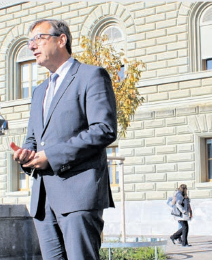
Josef Dittli, Ständerat UR

Cyber-Angriffe sind ein hochaktuelles Thema und Cyber Security ist längst auch militärstrategisch bedeutsam geworden. Die Schweiz ist hier verwundbar – meine Motion soll der Schweizer Armee die nötigen Mittel verschaffen.