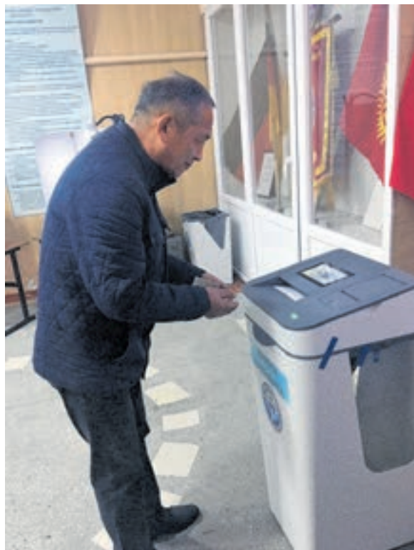
Das elektronische Wahlsystem.