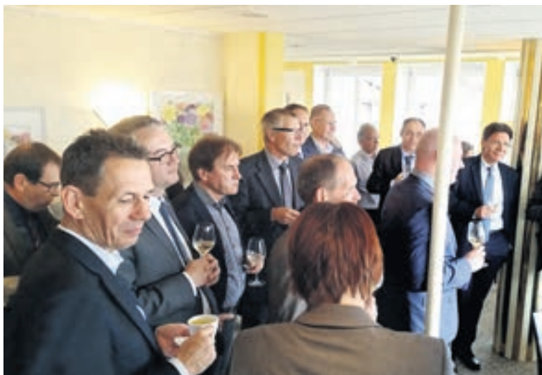
Gute Stimmung im «La Tourelle», dem Dachrestaurant des Hotels Roter Turm, wo sich die Fraktion und ihre Gäste zum Stehlunch einfanden.

Es ist schon seit einigen Jahren Tradition, dass die freisinnige Kantonsratsfraktion Kantonsangestellte und Vertreterinnen und Vertreter der Judikative zum Gespräch einlädt. Im Rahmen der Fraktionssitzung während der Novembersession fand dieser Austausch auch dieses Jahr wieder statt. Rund 20 Gäste folgten der Einladung zum Stehapéro im fünften Stock des Hotels Roter Turm in Solothurn. Mit dabei waren auch Vertreter des kantonalen Parteivorstands. Der direkte Draht von der Politik zur Verwaltung hilft, die gegenseitigen Bedürfnisse und Anliegen besser zu verstehen.