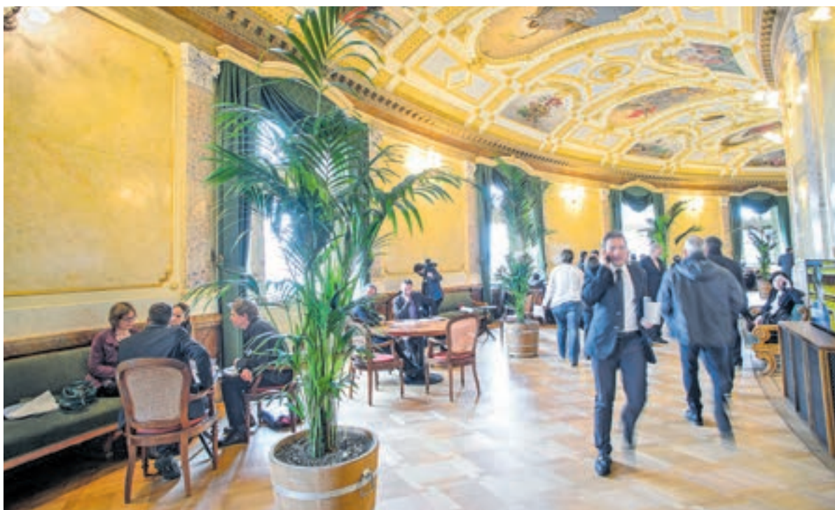
Blick in die Wandelhalle.

Die Rasa-Initiative wurde als direkte Reaktion auf die Annahme der Initiative «gegen Masseneinwanderung» vom 9. Februar 2014 lanciert. Mit der Initiative wollen die Initianten den Zuwanderungsartikel 121a als Ganzes wieder aus der Verfassung streichen.