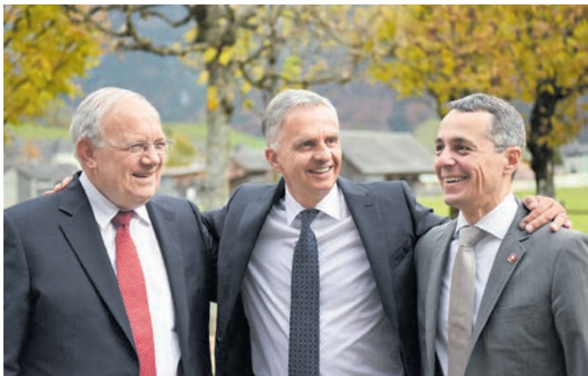
Didier Burkhalter, umrahmt von BR Johann Schneider-Ammann und BR Ignazio Cassis (DV Engelberg).

An dieser Stelle möchte ich Dir, Ignazio Cassis, herzlich gratulieren und wünsche Dir viel Erfolg für Dein neues Amt als Bundesrat und als EDA-Chef. Du wirst sehen: Aussenpolitik hat nichts Fremdes an sich. Denn auch die Schweizer Aussenpolitik findet ihren Ursprung in den Werten unserer Verfassung, die das Beste aus dieser Welt verbindet: Frieden, Demokratie, Menschenrechte, Armutsbekämpfung und Umweltschutz.